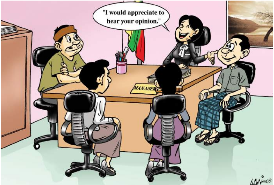
ပြည်သူများ၏ မြေပိုင်ဆိုင်မှုနှင့် ဒေသခံများအား ပြန်လည်နေရာချထားခြင်း

အပိုဒ်(၁၇)။ ။ အပြည်ပြည်ဆိုင်ရာ လူ့အခွင့်အရေးကြေညာစာတမ်း “လူတိုင်းသည် အခြားသူများနှင့်အသင်းဖွဲ့ခြင်းဖြင့်လည်းကောင်း၊ မိမိတစ်ဦး တစ်ယောက်အတွက်သော် လည်းကောင်း ပစ္စည်းဥစ္စာကို ပိုင်ဆိုင်နိုင်ရန် အခွင့်အရေးရှိသည်။ မည်သူတစ်ဦးတစ်ယောက်ကိုမျှ ၎င်း၏ ပစ္စည်းဥစ္စာပိုင်ဆိုင်မှုကို ခံစားခွင့်မပေးပဲ မတရားသဖြင့် ပိတ်ပင်ထားခြင်း မပြုရ။”