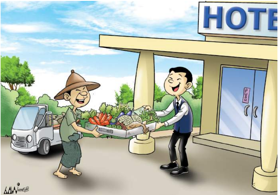
ဒေသခံလယ်သမားများထံမှ ထွက်ကုန်များဝယ်ရန် စဉ်းစားပါ